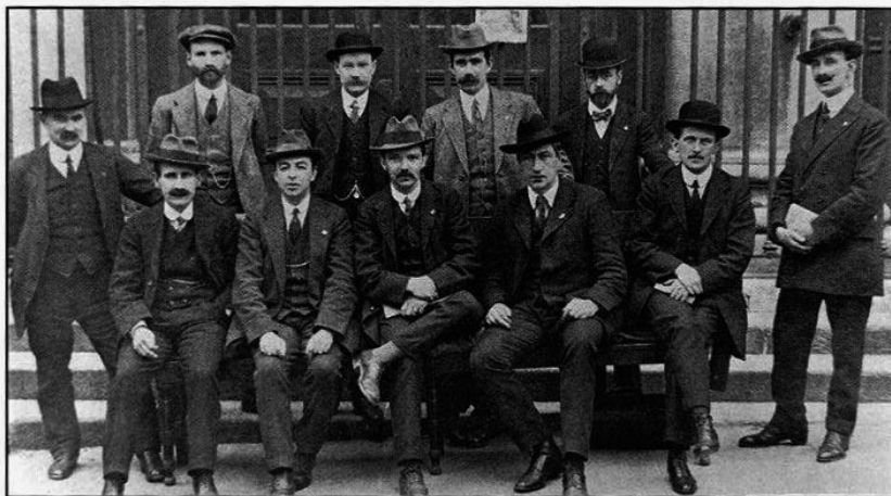
The National Executive of the Irish TUC and Labour Party, 1914

http://www.marxists.org/archive/lenin/work/s/1920/jun/05.htm